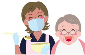
日本で活躍するネパール人材の増加